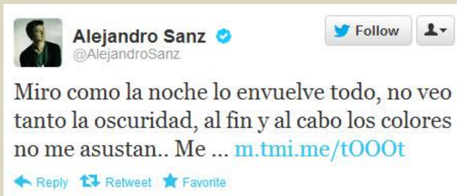
Alejandro Sanz, especialista en tuits de tamaño extra-largo

Lo siento, pero 140 caracteres es realmente demasiado poco para que me pueda expresar correctamente. Vale que hay aplicaciones para escribir tuits más largos , pero esa no es la esencia de Twitter.