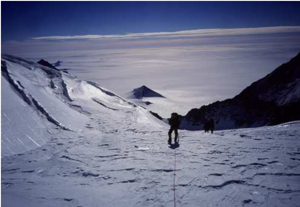
Miembros de la expedición tratando de acercarse a la pirámide.

En caso de que los investigadores prueben que las pirámides son estructuras hechas por el hombre, el descubrimiento podría llevar a cabo la mayor revisión de la historia de la humanidad como jamás se ha hecho.