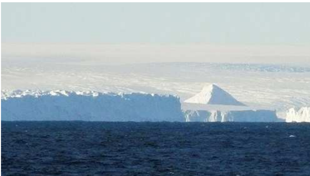
La imagen muestra una estructura piramidal rodeada de hielo justo en el centro de la foto, en la costa.