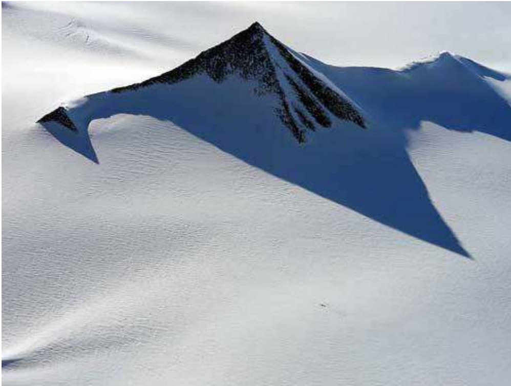
Imagen aérea tomada a través del hielo del Polo Sur parecen mostrar dos o posiblemente tres pirámides en una fila en similar formación a las pirámides de Giza.